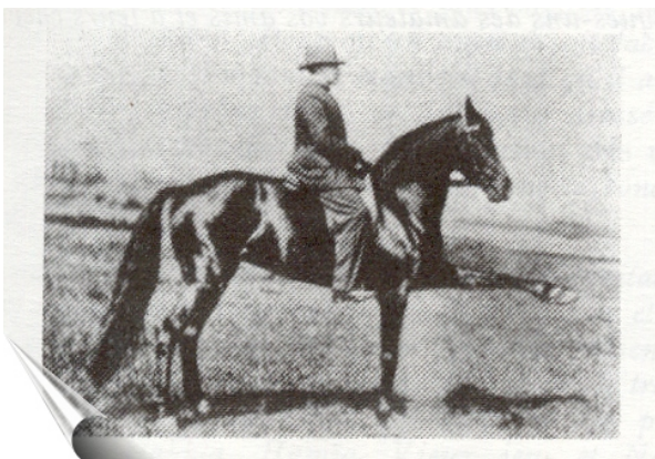
Vallerine - Extension du membre antérieur gauche

Etienne Beudant - “Souvenirs Équestres - 1934”