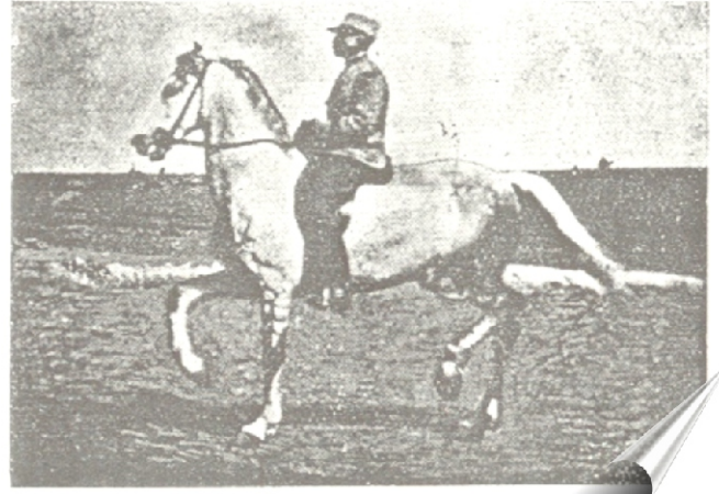
Mabrouk - Passage, position d'extérieur

“ Baucher exigeait la possession complète des forces du cheval ( légèreté parfaite ). Pour cela il veut que le cheval se place en arrière de la main, tout en se grandissant , en même temps qu’il coule en avant des jambes. ”