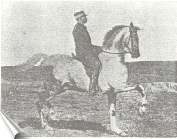
Mabrouk - Piaffer au ramener, 1915

“ Baucher exigeait la possession complète des forces du cheval ( légèreté parfaite ). Pour cela il veut que le cheval se place en arrière de la main, tout en se grandissant , en même temps qu’il coule en avant des jambes. ”