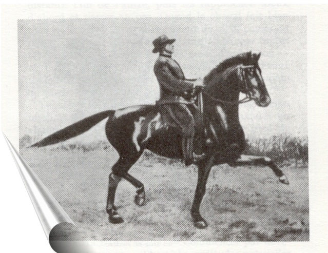
Fig. 16. - Vallerine (1926), au Passage étendu.

Il pourrait être écrit: Pour éduquer un être, ne faut-il pas d'abord s'éduquer soi-même? Et ne rien faire par colère est certainement la première de toutes les règles et la loi constante que l'éducateur doit s'imposer.