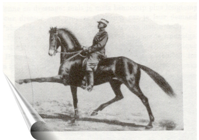
Fig. 18. - Robersart II (1914), au Trot à extension soutenue.